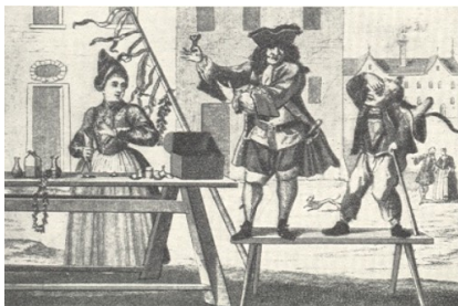
Charalatan, Hanswurst und Medikamentenverkäuferin, 18. Jh.